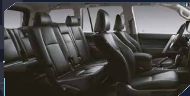
Foto muestra tapicería de referencia

La especialmente confortable y espaciosa cabina de Prado asegura la satisfacción de todos a bordo.